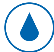
Comet TW Premium