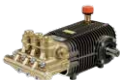
Comet TW 500 Premium