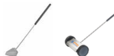
Lancia a vapore per diserbo angolata e carrellata Bent and wheeled weed killer steam lance