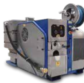
POWERSTEAM VERSION / VERSIONE

Complete version with 300/400/500 l tank kit and UNI-45 filling kit Versione completa con kit serbatoio da 300/400/500 l e kit UNI-45 per riempimento