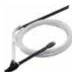
Hydrosandblasting kit Kit per idrosabbatura