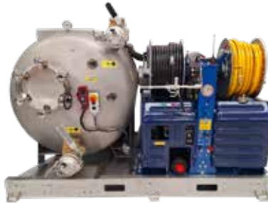
VORTEX COMBI 1000 WHALE