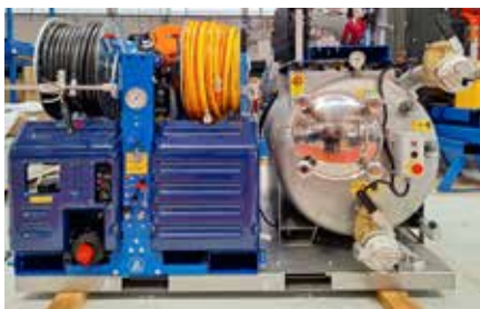
VORTEX COMBI 400 WHALE