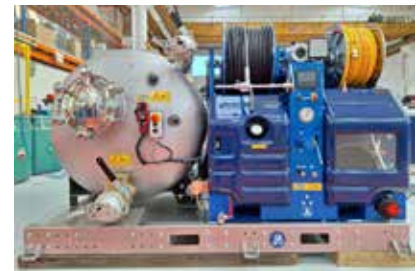
VORTEX COMBI 400 SALMON