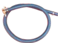
5 m hose Ø 80 mm for suction with steel quick coupling 5 mt tubo Ø 80 mm per l'aspirazione con innesto rapido inox