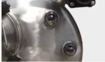
Double level indicator Doppio indicatore di livello

Manual loading and discharge brass valve